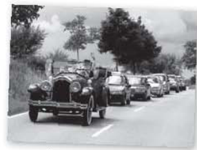
On prend la route.