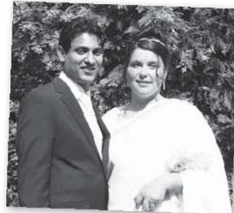
Le mariage de ma sœur